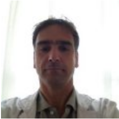
Javier Alaba Trueba