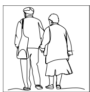
ASOCIACIÓN DE PERSONAS MAYORES