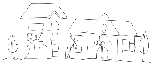
TODO EL PUEBLO